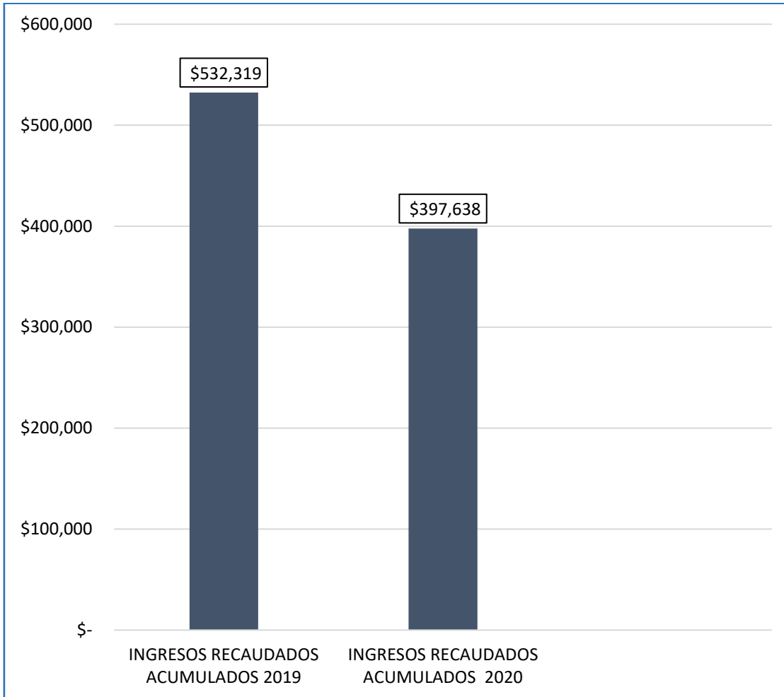
Gráfica 1. Comparativos ingresos recaudados acumulados de los Fondos Especiales del año 2020 vs. lo recaudado en el mismo período de 2019

Fuente: Cálculos realizados por la División de Fondos Especiales DEAJ/ Cifras en millones de pesos.